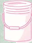
B [廃油とカセイソーダ 溶液を混ぜる容器] (10L以上)