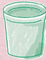
石けんを混ぜ合わせるため の容器(30L以上)