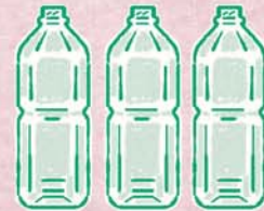
小分け用のペットボトル容器 (2Lのペットボトルで15本程度)